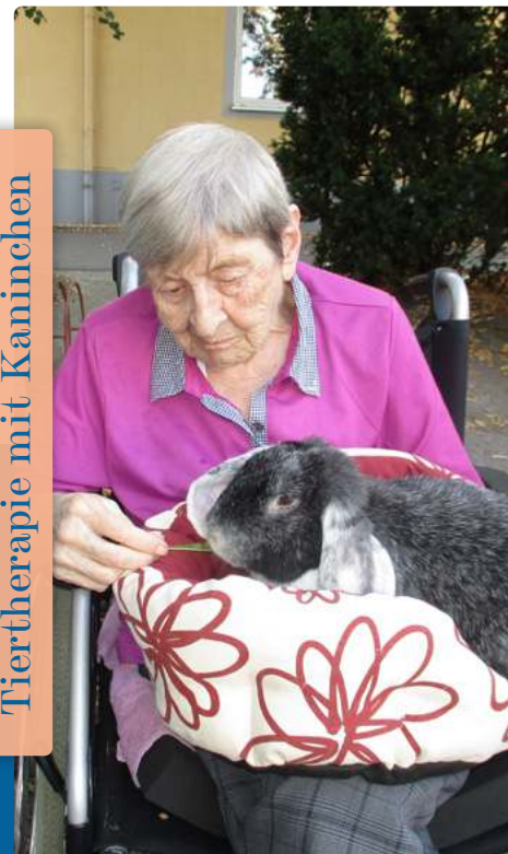
Tiertherapie mit Kaninchen