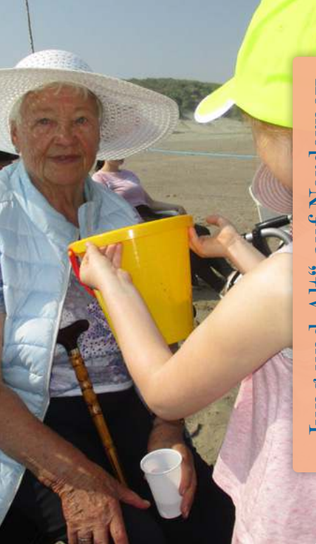
„Jung und Alt“ auf Norderney