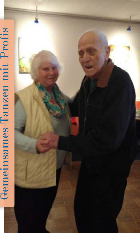
Gemeinsames Tanzen mit Profis